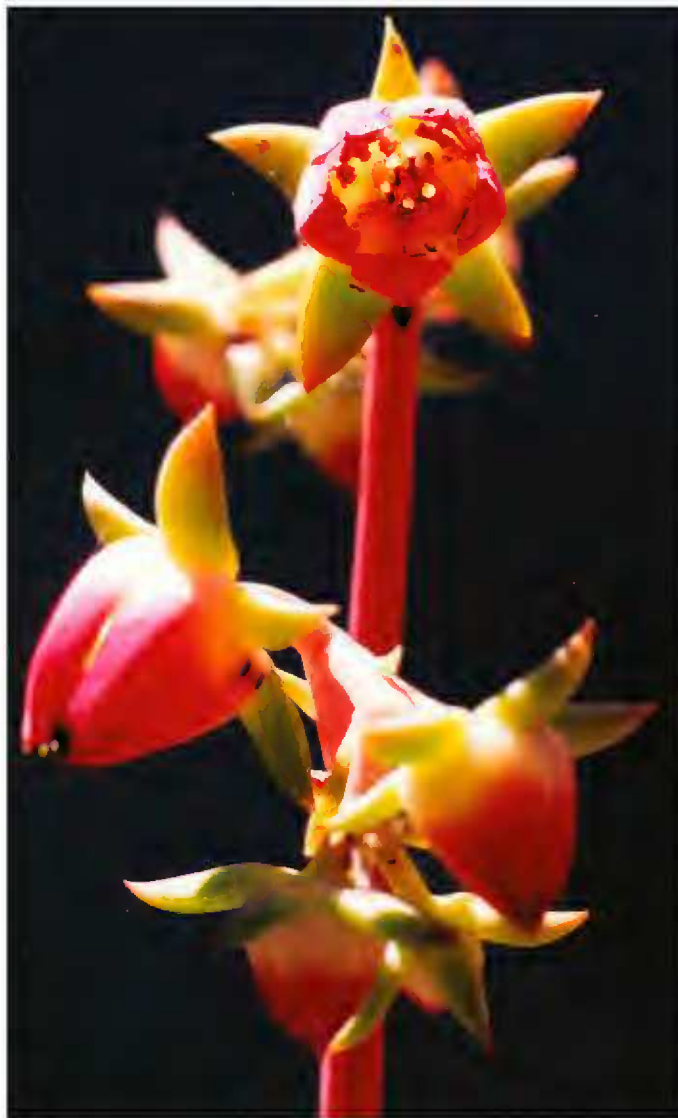
Fig. 2. Inflorescencia de Echeveria patriotica , las flores muestran los colores de la bandera mexicana que denotan el epíteto específico.

color rojo-púrpura, las otras los tienen blanquecino-amarillentos. El segundo subconjunto está integrado por plantas caulescentes, con pocas hojas, rara vez en roseta basal, las láminas por lo general son manifiestamente pseudopecioladas y sus flores tienen los nectarios pálidos; aquí pertenecen: E. acutifolia Lindley, E. crenulata Rose, E. fimbriata C. H. Thompson, E. gibbiflora De Candolle ( E. grandifolia Haworth, E. violescens E. Walther, E. gibbiflora var. violescens (E. Walther) Kimnach), E. gigantea Rose & Purpus, E. grisea E. Walther, E. longiflora E. Walther, E. pallida E. Walther, E. rubromarginata Rose y E. nayaritensis Kimnach.